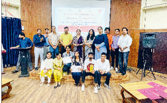
नारनौल। विद्यार्थियों को सम्मानित करते कॉलेज स्टाफ सदस्य।