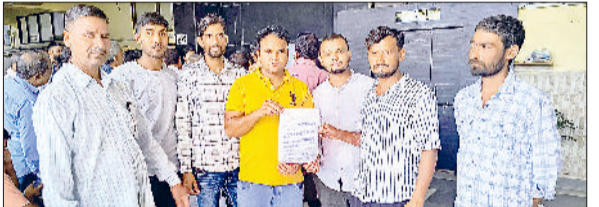
नारनौल। उपायुक्त को झापन सौंपने जाते ग्रामीण।