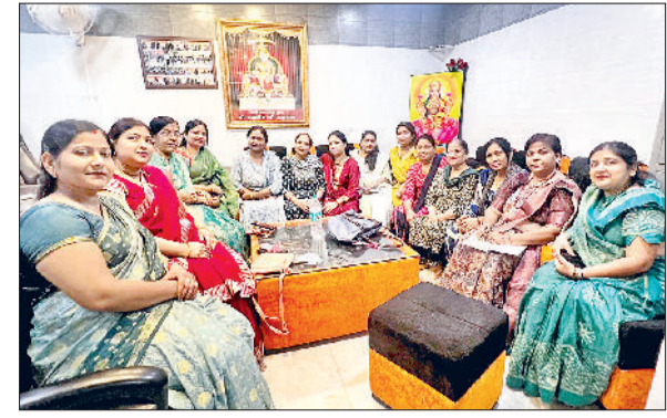
नारनौल। महिला प्रकोष्ठी की बैठक में हिस्सा लेती समाज की महिलाएं।