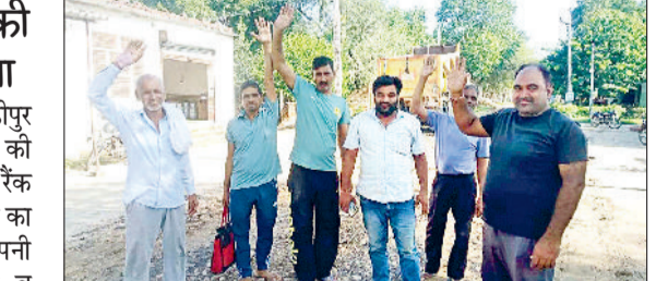
महेन्द्रगढ़। नारेबाजी करते ग्रामीणों।