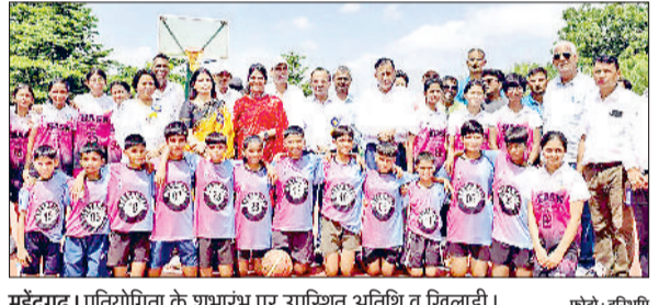
महेंद्रगढ़। प्रतियोगिता के शुभारंभ पर उपस्थित अतिथि व खिलाड़ी।