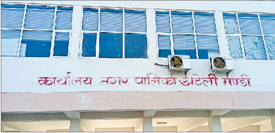
मंडी अटेली। नगर पालिका कार्यालय।