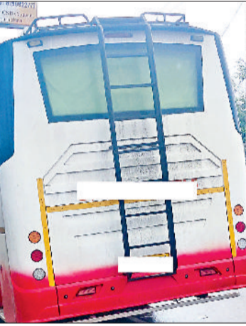
नारनौल। बस स्टैंड के बाहर खड़ी परमिट बस।