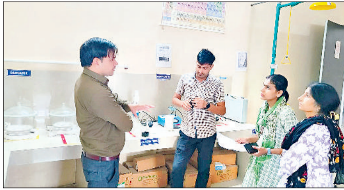
नारनौल। पेयजल जांच संबंधी प्रशिक्षण देते हुए लैब सहायक।

नारनौल शहर से सात स्वयं सहायता समूहों ने टेंडर भरे थे, जिनमें से मुख्यालय द्वारा जय भोला भंडारी स्वयं सहायता समूह को कार्य सौंपा गया है। इस समूह की महिलाएं घर-घर जाकर इन गतिविधियों को अंजाम देंगी।